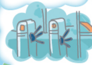
Охрана с турникетом