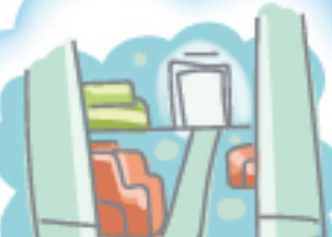
Зона отдыха (рекреация)